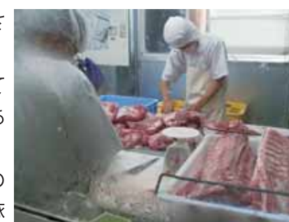
工房内での作業風景

綾瀬市の学校給食でソーセージを使用しており、参加者からは是非自分の学校でも使ってみたいという声が聞かれました。使用したい学校は、(株)高座豚手作りハムにお問合せください。(電話 0467-76-8611)