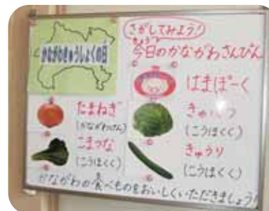
食堂入り口の掲示板

県立みどり養護学校は、昭和53年1月に開設された、横浜市緑区の高台に位置する学校です。学校のなだらかなスロープを上りきると、緑の木々に囲まれた白い校舎が出迎えてくれました。現在、小学部、中学部、高等部の231名の児童生徒が、毎日元気に学校生活を送っています。