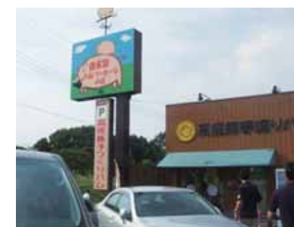
高座豚手作りハム工場の店舗

高座豚手作りハムは、昭和59年に、神奈川県下の養豚農家が協同で設立した会社です。豚を丸ごと一頭無駄なく利用するため、自社の工房でベテランの職人さんによって、原料肉の脱骨(枝肉から骨を抜く作業)から取りかかります。