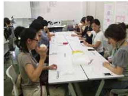
バター作りに挑戦