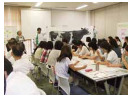
等身大の牛の絵を使っの話