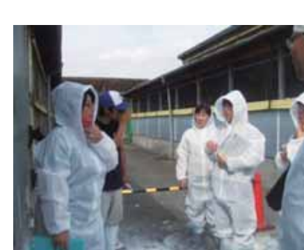
防護服を着用しての見学風景

妊娠中の豚が出産し、誕生したばかりの子豚が授乳期、離乳期と成長し、やがて出荷されるまでの成長の段階を見学することができました。1.5kgで生まれた子豚が、およそ6ヶ月で115kgに成長します。