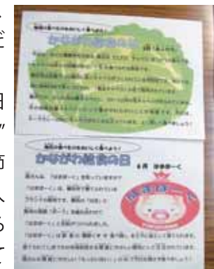
クラスに配布するおたより