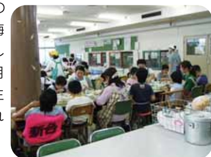
食堂での食事風景